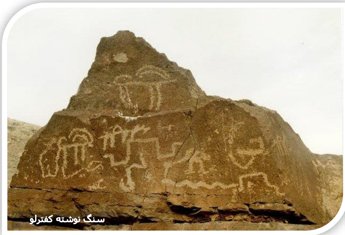
سنگ نوشته کفترلو

شهرستان ملارد در جلگه و دشتی واقع شده که اطراف آن تمدن‌های بسیاری از عصر آهن تا اشکانیان و ساسانیان، دوران پیش از تاریخ و حتی دوران اسلامی وجود دارد. براساس کاوش‌های باستان‌شناسی سال ۱۳۹۰ در تپه پیش از تاریخ ارسطو، قدمت این شهرستان در حدود ۹ هزار سال تخمین زده شده و یکی از قدیمی‌ترین نقوش برجسته با نام نقوش صخره‌ای کفترلو با قدمتی ۴۵۰۰ ساله در دهستان اخترآباد از توابع بخش صفادشت شهرستان ملارد قرار دارد.