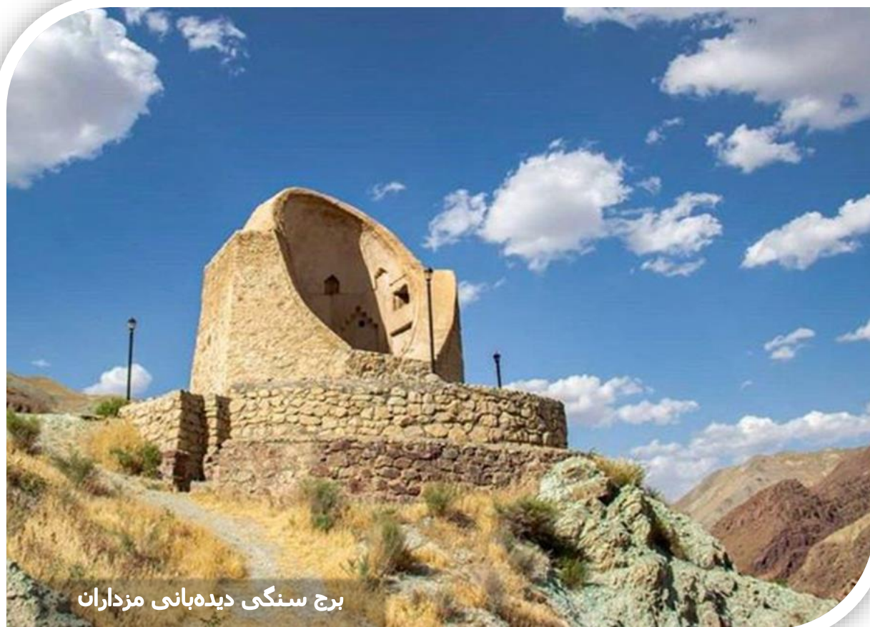
برج سنگی دیده‌بانی مزداران

شهرستان فیروزکوه شهرستانی قدیمی است که برخی آن را با حوادث مرتبط با دماوند همچون افسانه فریدون و ضحاک مرتبط می‌دانند. یکی از نوشته‌های معتبر درباره تاریخ این شهرستان به نوشته محمدبن جریر طبری (۳۱۰-۲۲۶ ق.ه) در کتاب تاریخ الرسل و الملوک باز می‌گردد. در این نوشته، طبری احداث آن را به فیروز ساسانی در ری نسبت داده است. نام قدیمی فیروزکوه دیمه بوده است که به معنی طبیعت خودرو است. داشتن طبیعت بکر و انواع جاذبه‌های طبیعی مانند کوهستان برفی زیبا در زمستان، دشت‌ها و رودخانه‌ها، تنگه‌ها و چشمه‌های آب معدنی متعدد، مناطق کوهستانی و ییلاقی و وجود آثار تاریخی و تفریحی نظیر قلعه لاجورد، حمام قدیمی زرمان، برج سنگی دیده‌بانی مزداران، قلعه باباریش، تنگه واشی، حبله رود، شکارگاه ممنوع گاوده، پیست اسکی سیپلند و ... این شهرستان را از نظر گردشگری از سایر شهرستان‌های استان متمایز می‌نماید.