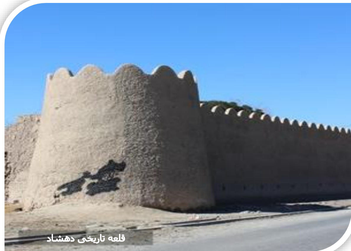
قلعه تاریخی دهشاد

با مراجعه به کتب معتبر و تاریخی و اظهار نظرهای مورخین می‌توان دریافت که شهرستان شهریار از سابقه بسیار طولانی برخوردار است. قدمت برخی از آثار باستانی و بناهای تاریخی به هزاره‌های قبل از میلاد و ظهور دین مقدس اسلام بر می‌گردد. همچنین وجود بقاع متبرکه و مزار نوادگان ائمه اطهار (ع) نشان دهنده دین‌داری و دین‌باوری مردم این منطقه از میهن پاک کشورمان می‌باشد.