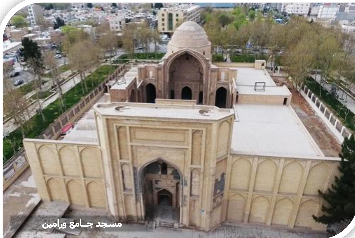
مسجد جامع ورامین

شهرستان ورامین از سده‌های نخستین اسلامی به عنوان یکی از نقاط مرکزی شیعیان مطرح شد ولی اوج شکوفایی آن تا پیش از دوران معاصر، در دوره ایلخانان مغول بود و بناهای تاریخی شاخص این شهرستان مانند مسجد جامع و برج مقبره علاءالدوله به این دوره تعلق دارند. تاکنون بیش از ۱۶۵ اثر در این شهرستان شناسایی شده که ۶۸ اثر آن در فهرست آثار ملی قرار گرفته است. این شهرستان از آغاز حکومت قاجاریان و پایتخت شدن تهران رونق بیشتری یافت و در دوران پهلوی با ساخته شدن کارخانه‌ها، مانند کارخانه قند بر اهمیت آن افزوده شد. جاذبه های تاریخی مهم این شهرستان تنها به مسجد جامع و برج علاءالدوله ختم نمی‌شود، قلعه ایرج، پل تاریخی باقرآباد، آب انبار حصارگلی، قلعه اربابی عرب‌ها، روستای تاریخی خاوه و ... از دیگر آثار تاریخی این شهرستان هستند.