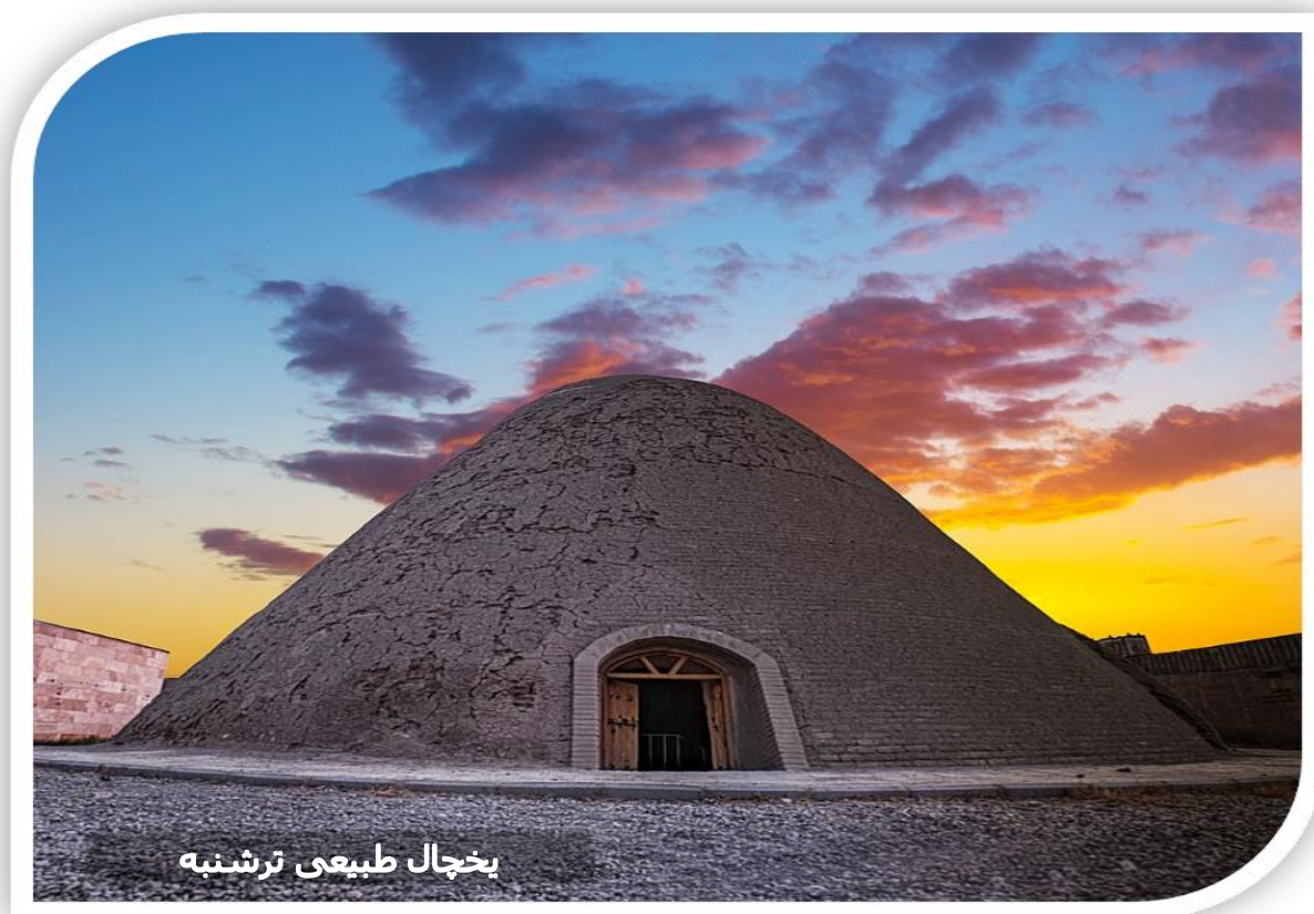
بخچال طبیعی ترشنبه

شهرستان اسلامشهر در روزگار کهن روستایی به نام قاسم‌آباد شاهی بوده است. پژوهش‌های انجام شده حاکی از آن است که اسلامشهر همواره در طول تاریخ به علل گوناگون مورد توجه بوده و از کهن‌ترین سکونت‌گاه‌های تاریخی ایران محسوب می‌شود.