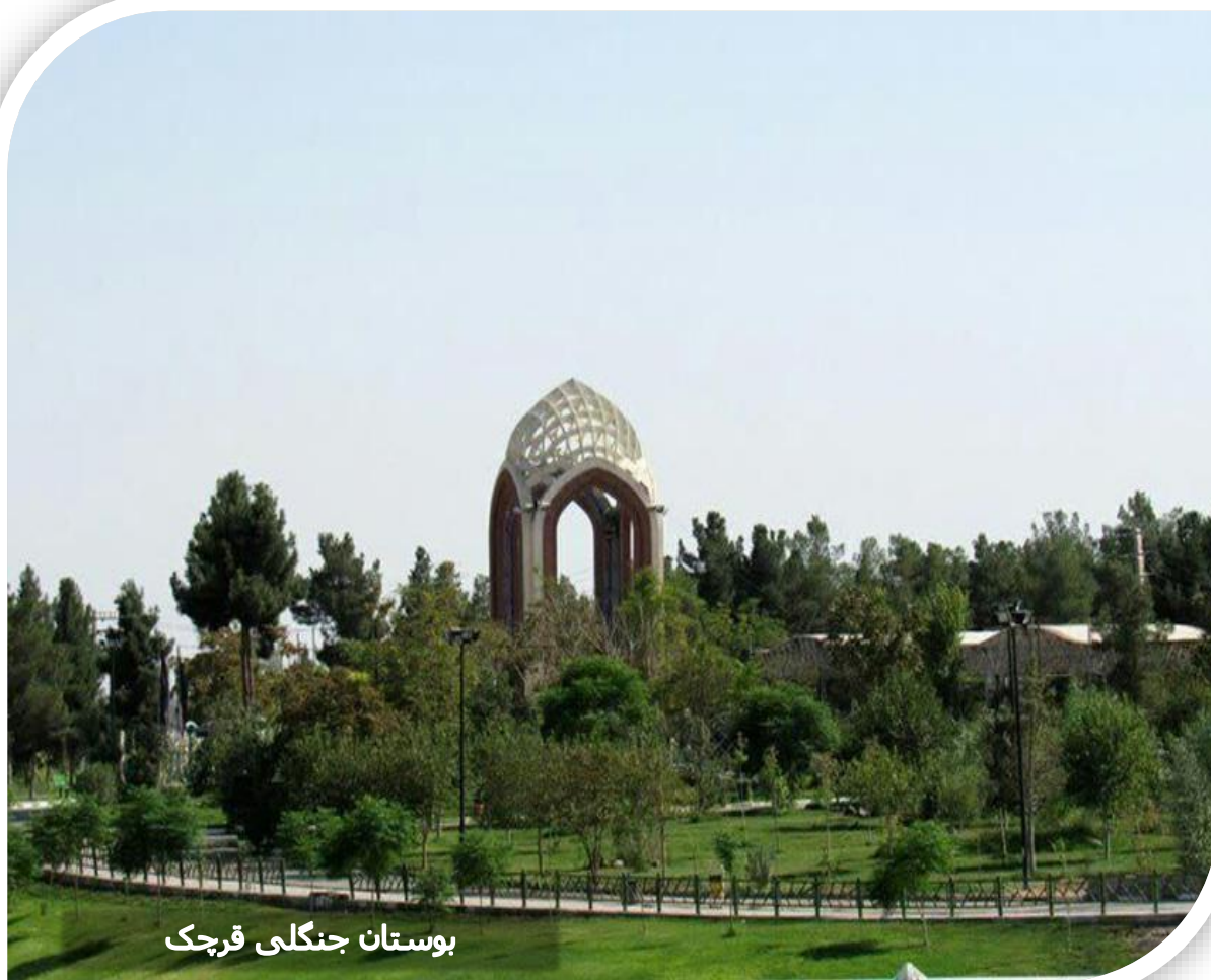
بوستان جنگلی قرچک

وجه تسمیه شهرستان قرچک به سبب وجود پست بازرسی روس‌ها در جریان جنگ دوم جهانی، در کنار ایستگاه قطاری بود که برای بازرسی محموله‌های گندمی که به مقصد اتحاد جماهیر شوروی فرستاده می‌شد، ایجاد کرده بودند. از این‌رو مردم بومی به آن جا قریه چک می‌گفتند. هسته اصلی شکل‌گیری این شهرستان به سبب ایجاد کوره‌پزخانه‌ها شکل گرفته است.